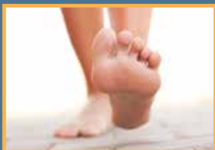
Beine & Füße

In diesen Körperregionen spielt die Nervenregeneration eine besonders wichtige Rolle.