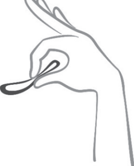
Abbildung 2 Drücken Sie den Ring zusammen