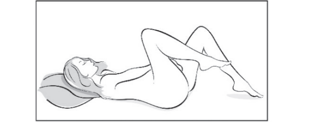
Abbildung 3 Nehmen Sie für die Einlage des Rings eine bequeme Haltung ein