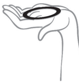
Abbildung 1 Nehmen Sie GinoRing® aus dem Beutel