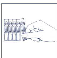
Abb. 1 Trennen Sie eine Ein-Dosis-Ophtiole vom Riegel und fassen Sie diese an der Etikettenseite an.